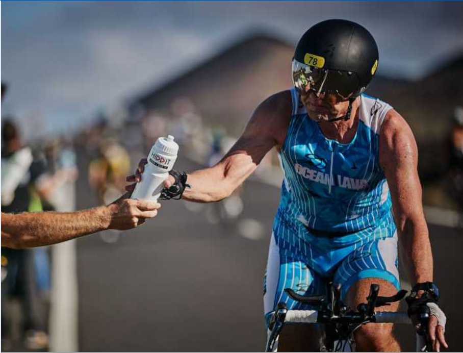
Un deportista aprovecha para hidratarse durante la Ocean Lava.