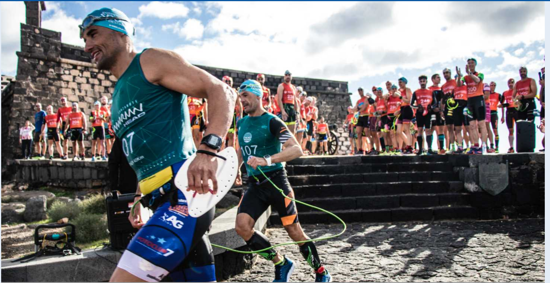
Varios corredores participan en la edición de la Swimrun Lanzarote 2018.