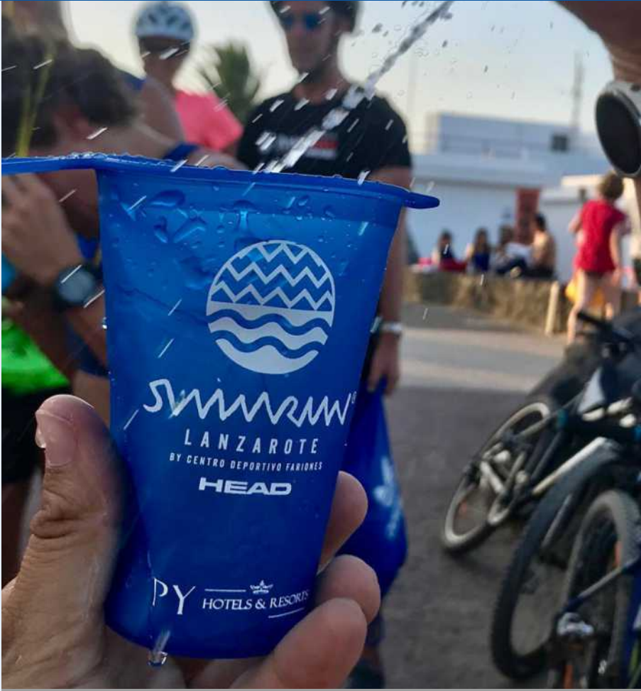
Los vasos utilizados en la prueba son reciclados y reutilizables.