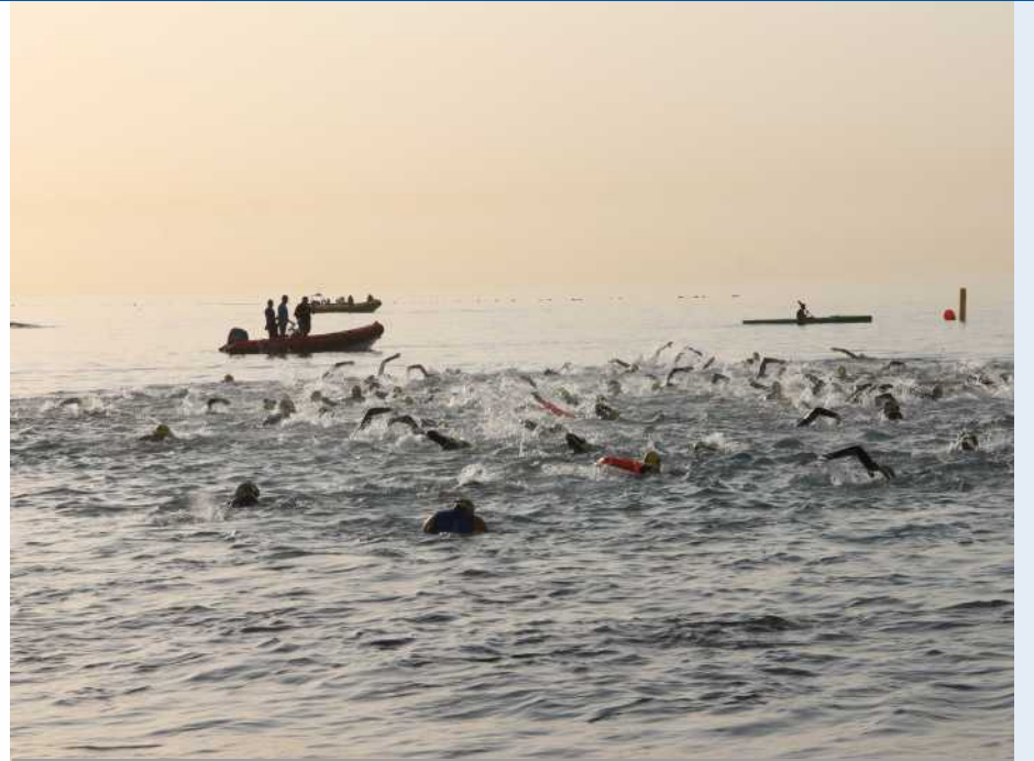
La salida se produjo nuevamente en Playa Grande de Puerto del Carmen.