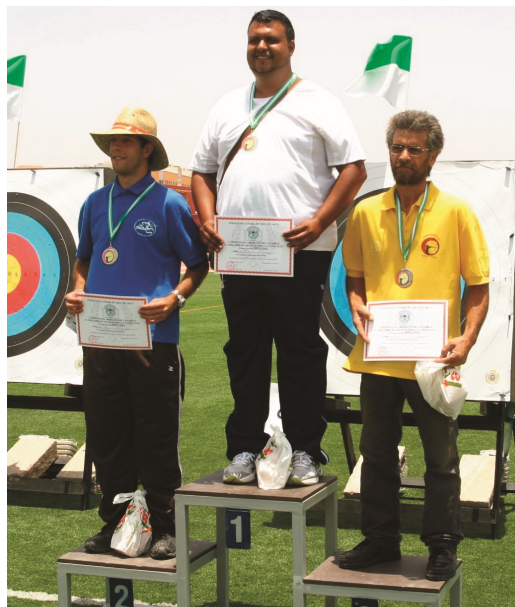
Podio de los ganadores.