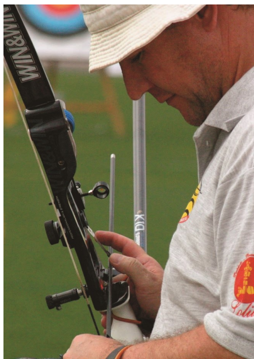
Un arquero concentrado antes de lanzar su flecha.

Un deporte a buen seguro desconocido por muchos pero que sirve para darle una mayor variedad a la isla de Lanzarote, que fuera de las disciplinas convencionales, que las tiene y además de calidad, cuenta con una serie de modalidades "mal llamadas minoritarias" que aportan un crecimiento indirecto pero perceptible a la isla conejera.