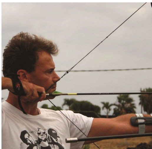
Instantánea justo antes del disparo

"En Lanzarote desde hace algún tiempo, el "Club La Flecha Lanzarote" se encarga de dar cobijo a todos aquellos amantes de este deporte"