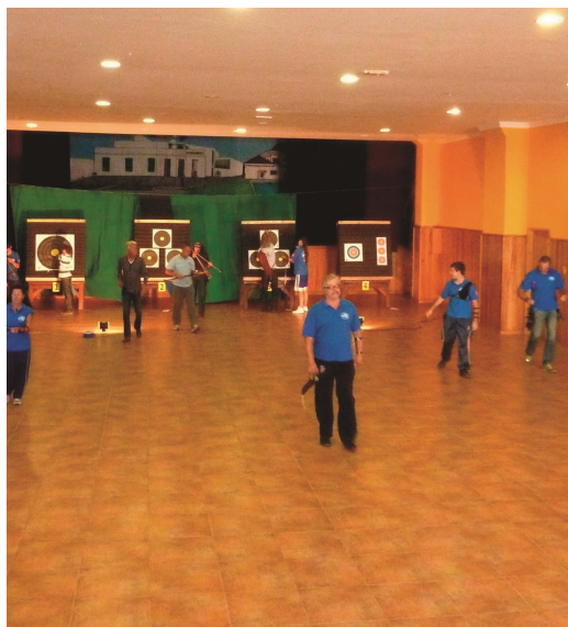
También se puede practicar el tiro con arco en interior

Para poder entender el tiro con arco, en su versión más deportiva y actual, hay que remontarse al pasado. La primera evidencia segura de arcos en Europa, proveniente de pinturas rupestres en las cuevas de Valltorta y Morella en España, data del paleolítico tardío, alrededor de hace 40.000 años. Sin embargo, no se tiene constancia segura de cómo ni cuándo se inventó el arco. La aparición del tiro con arco revolucionó en un principio la caza durante la prehistoria.