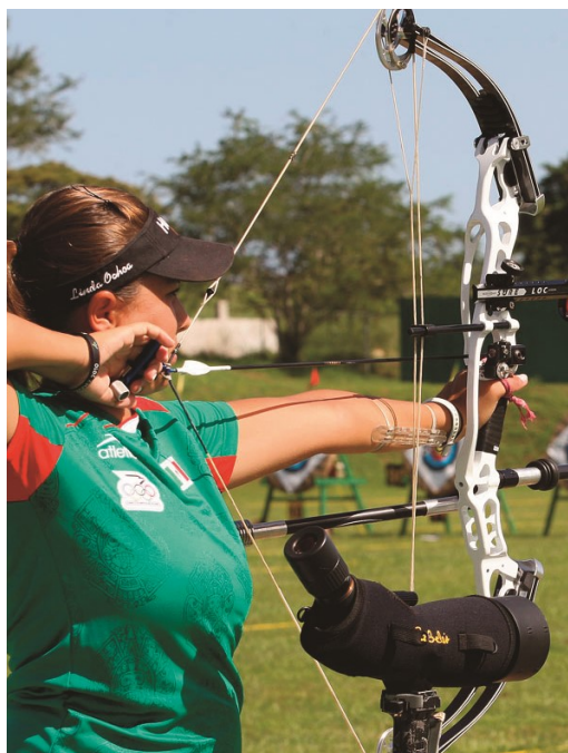
El tiro con arco también es practicado por muchas mujeres.