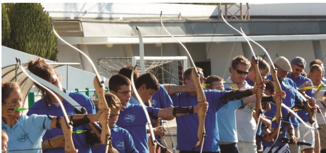
Varios integrantes del "Club La Flecha Lanzarote"

Otras, sin embargo, son más populares y no están recogidas en la FITA (Federación Internacional de Tiro con Arco) pero son muy practicadas como: