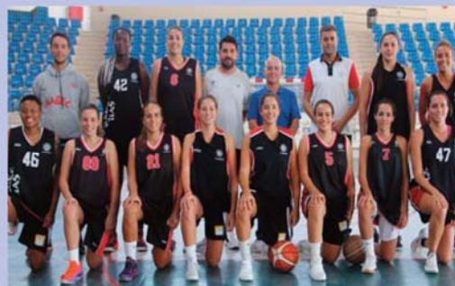
El Magec Tías CVG está haciendo una gran temporada en Liga Femenina 2

Si hasta ahora el CD Magec Tías no ha parado de superarse, esta temporada lo quie-