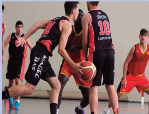
El club lanzarteoño logró un ascenso a la Liga EBA de baloncesto.

En 2009 se marcó la historia del baloncesto conejero de la mano del CD Magec Tías, por primera vez para Lanzarote, después de una fase de ascenso vertiginosa, el ascenso a Liga