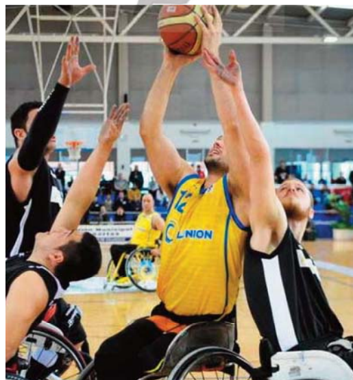
El baloncesto en silla de ruedas es otra de las modalidades de este deporte.