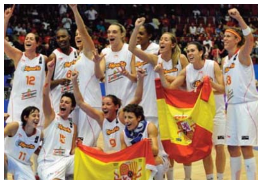
La Selección Española femenina ha conseguido muchos éxitos en los últimos años.

Otro cambio por ejemplo se da en los períodos, jugándose en cuatro cuartos de 10 minutos cada uno en caso de que se utilicen las reglas de la FIBA, o bien dividiéndose el partido cuatro cuartos de 12 minutos si utilizamos el reglamento de la NBA, aunque originalmente