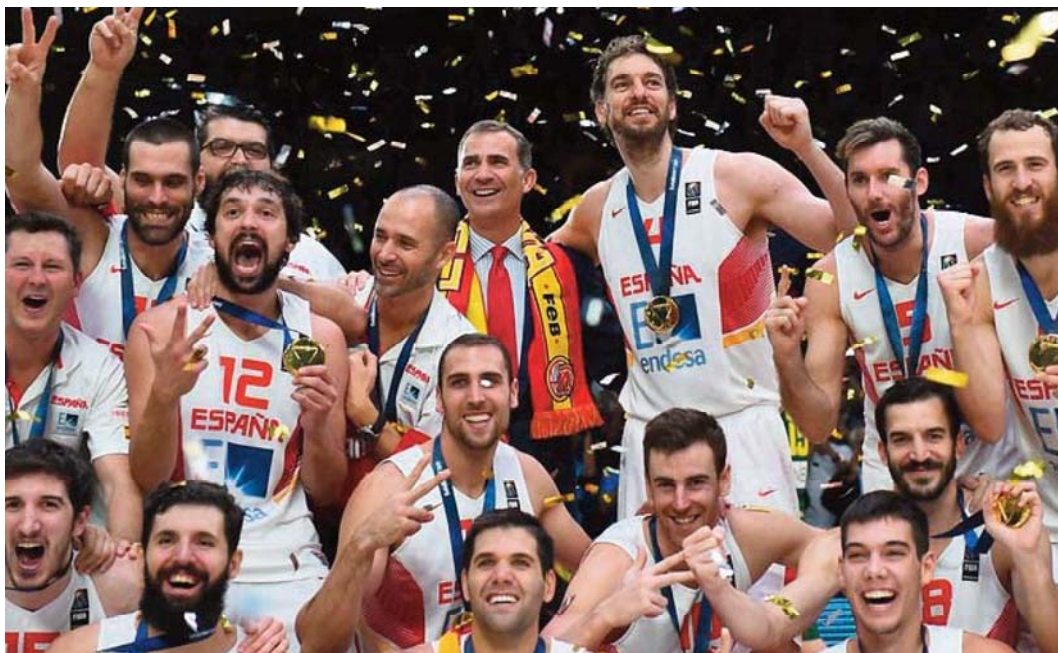
La Selección Española masculina ganó el Mundial en Japón 2006

era disputado en dos mitades de 15 minutos cada una.