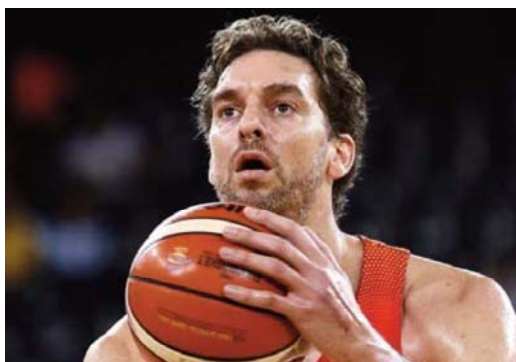
Pau Gasol fue el primer jugador español que destacó en la NBA.

El sistema de puntajes se basa en puntos dobles o triples dependiendo si son lanzados dentro de un área o fuera de ésta, y tiene distintas reglas acorde a las federaciones que regulen cada juego, definiendo los tiempos de juego como también el tiempo de descanso, que consta de un tiempo que oscila entre 15 y 20 minutos (dependiendo justamente del reglamento del campeonato)